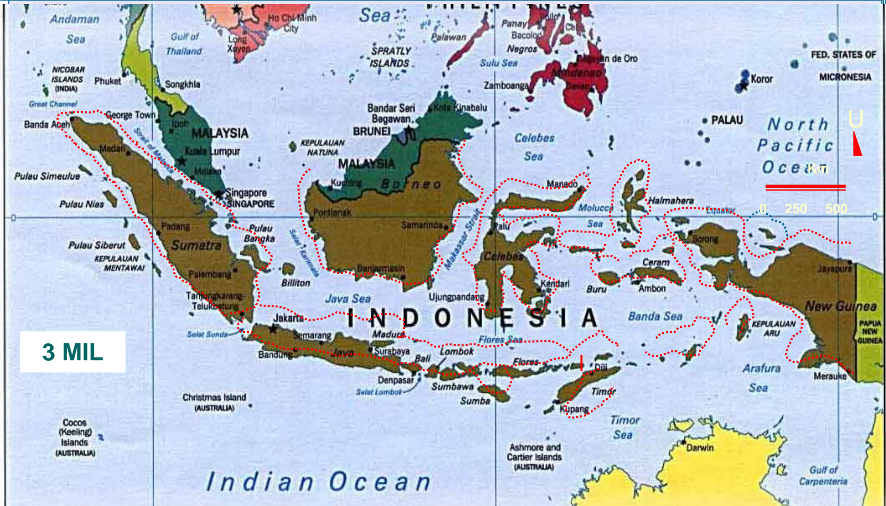
Bentuk dan luas wilayah Nusantara pada saat masih berlakunya TZMKO warisan Per-UUan Kolonial